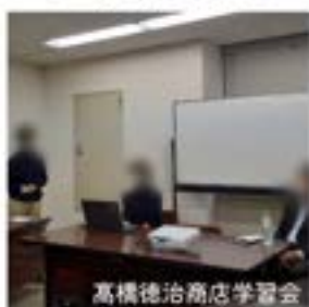
高槻徳治商店学習会