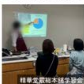
精華堂穀本穂学習会