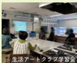
生活アートクラブ学習会