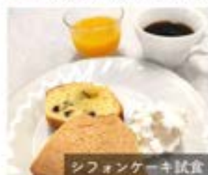
シフォンケーキ試食