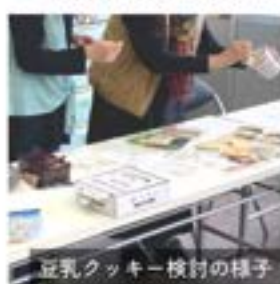
豆乳クッキー検討の様子