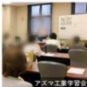
アズマ工業学習会