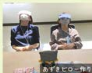
あずきピロー作り