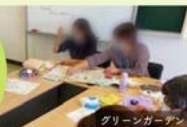
グリーンガーデン