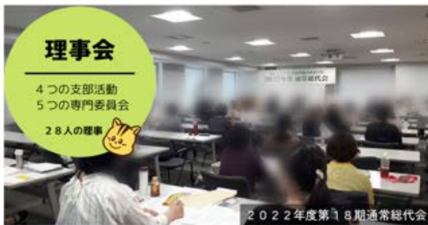
2022年度第18期通常総代会