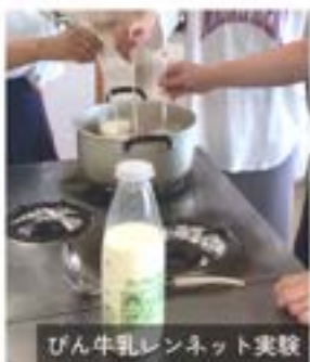
びん牛乳レンネット実験