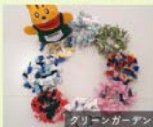
グリーンガーデン