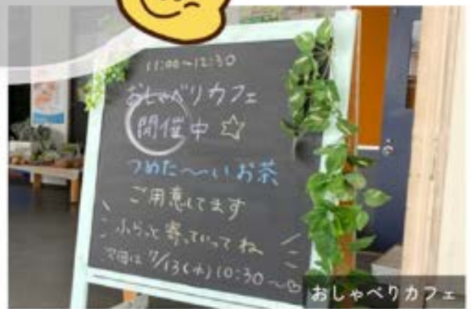
おしゃべりカフェ