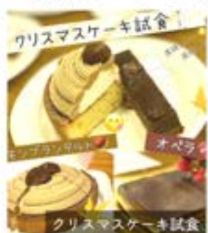
クリスマスケーキ試食