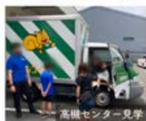
高槻センター見学