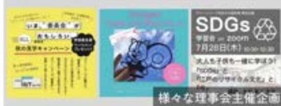
様々な理事会主催企画