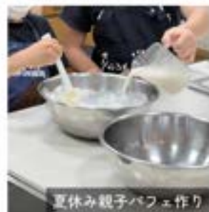
夏休み親子パフェ作り

①阿倍野区民センター②8名 ③委員会の歴史は古く、アットホームであたたかい委員会。カタログを見はじめると、「食べてみたよ」と報告がはじまり盛り上がります。どんどんおいしいたべものや商品、活動を知って沼にはまっています。