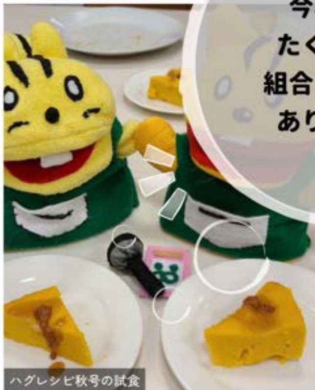
ハグレンシビ秋号の試食